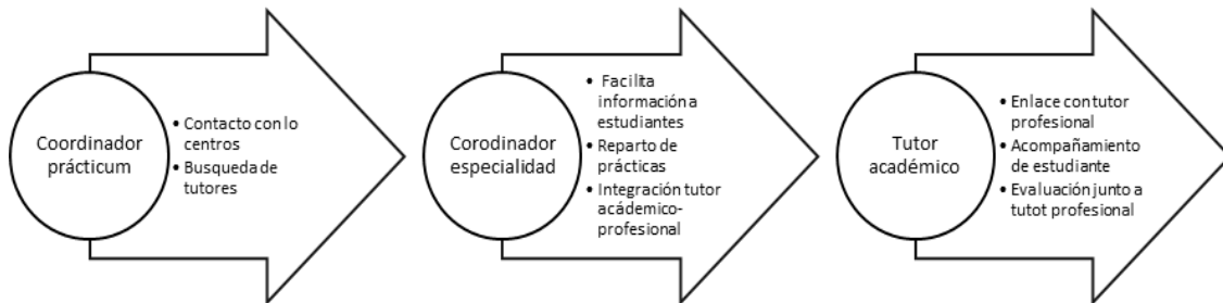
Figura 2. Proceso de coordinación prácticas

La Universidad de Salamanca cumple con sus compromisos recogidos en el Convenio de Prácticas, pero se ha señalado en diferentes reuniones que sería deseable un Decreto propio de Prácticum de la Junta de Castilla y León que regulase y cubriese las expectativas de los tutores, estableciendo mecanismos para un mayor reconocimiento laboral y social de los profesores tutores de los centros. El proceso de “captación de tutores” se realiza desde la Universidad mientras en el Convenio se indica que lo debería realizar la Consejería.