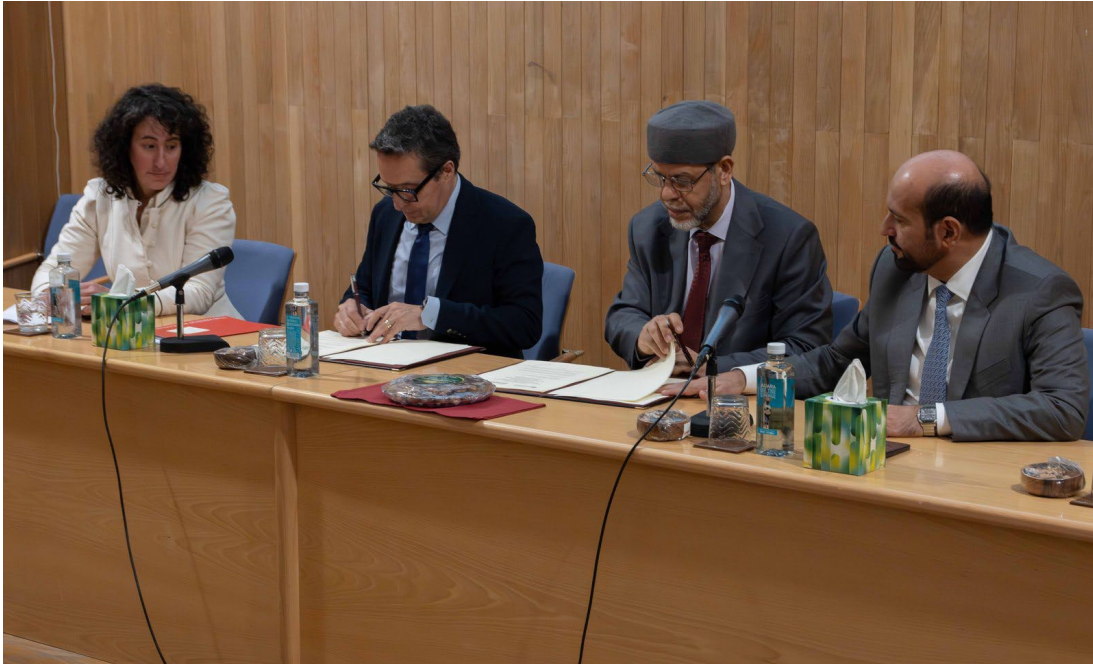
Figura 2. Inauguración del Centro de Lengua Árabe en el Palacio de San Boal.