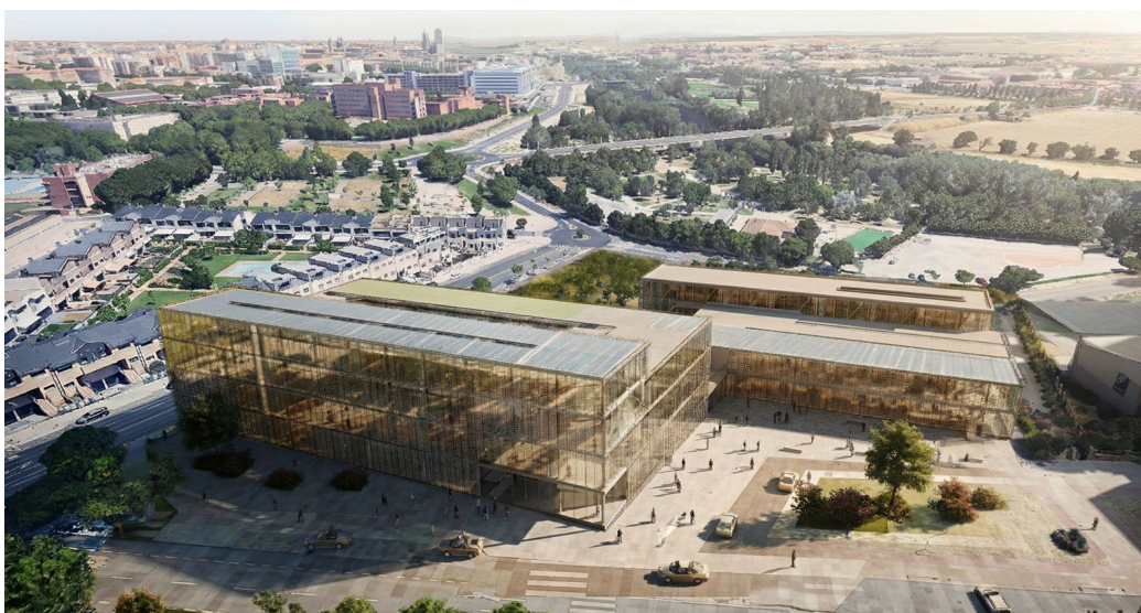
Infografía de la nueva Facultad/Clínica de Veterinaria de la Universidad de Salamanca (vista aérea).

Programa de inversiones en infraestructuras de la Universidad de Salamanca