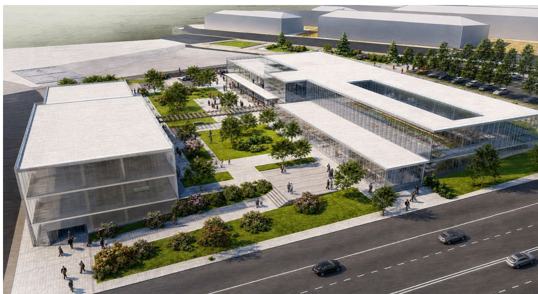
Figura 1. Infografía de la nueva Facultad/Clínica de Veterinaria, hospital veterinario y laboratorios clínicos (vista aérea).

El 9 de enero de 2026, el presidente de la Junta de Castilla y León firmó con los rectores de las cuatro universidades públicas de la Comunidad un protocolo de colaboración para un plan extraordinario de inversiones de 125 millones de euros. La Universidad de Salamanca recibirá 43 millones de euros —entre 7 y 7,3 millones anuales hasta 2031—, adicionales a los cerca de 4 millones que percibe desde 2025. Estos recursos, junto a la financiación propia y a las aportaciones de la Diputación y el Ayuntamiento, permitirán acometer el conjunto de actuaciones recogidas en este plan.