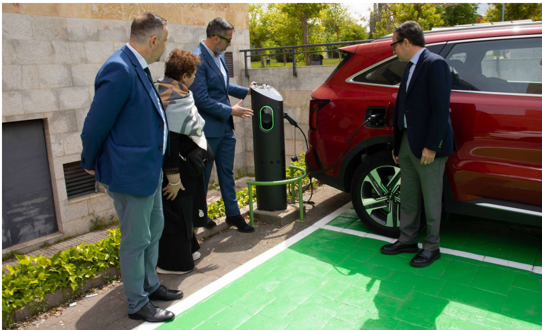
Figura 6. Nuevos puntos de recarga para vehículos eléctricos instalados por la Oficina Verde en los campus.