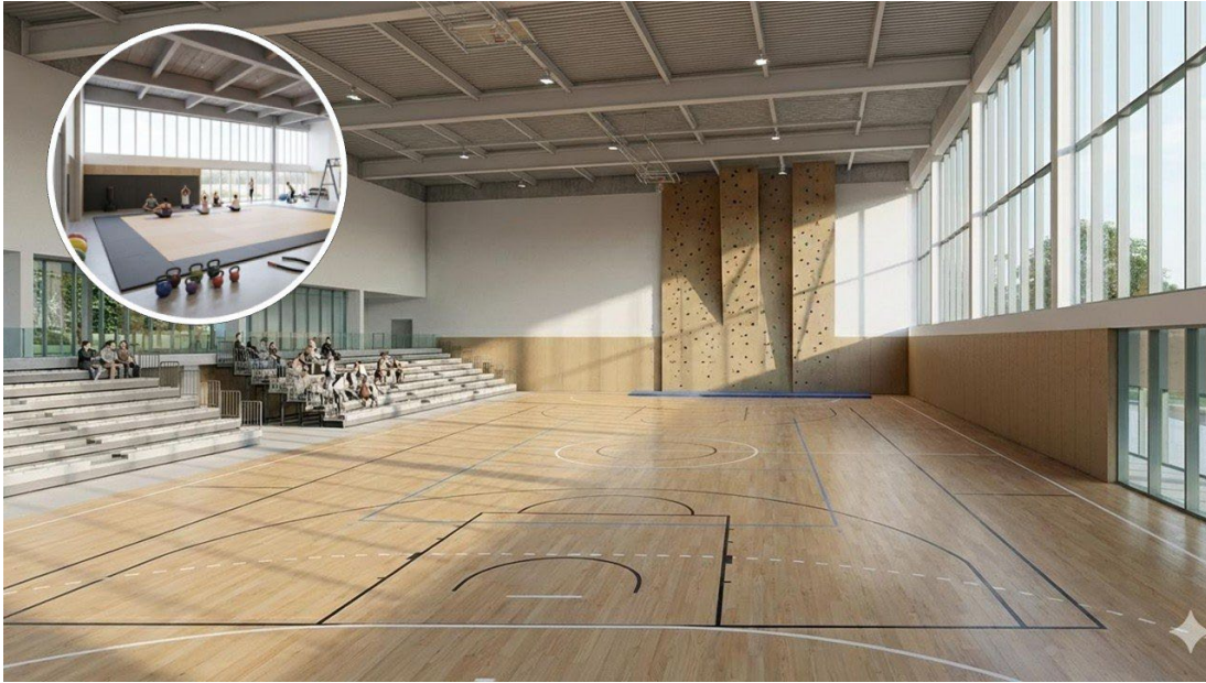
Figura 7. Proyecto del nuevo polideportivo y espacios de estudio y docencia del Campus de Ávila.