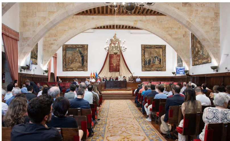
Figura 1. Sesión del Claustro de la Universidad de Salamanca en la que se aprobaron los nuevos Estatutos USAL26.

La propuesta aprobada responde a tres objetivos fundamentales: adaptar el texto a la LOSU, corregir lagunas normativas acumuladas con el paso del tiempo y dotar a la Universidad de una estructura estatutaria acorde con los retos del presente.