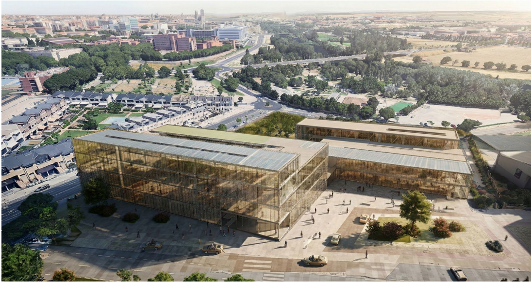
Figura 4. Infografía de la nueva Facultad/Clínica de Veterinaria, hospital veterinario y laboratorios clínicos (vista aérea).