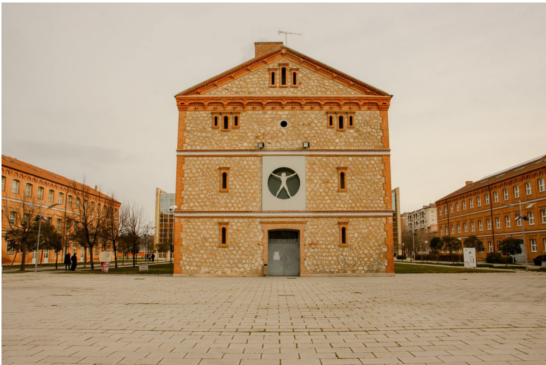
Figura 8. Vista del Campus Viriato de Zamora, que afronta una profunda modernización.

En el Campus Viriato de Zamora se ampliarán las aulas docentes, con una inversión estimada de 3,80 millones de euros (obra y equipamiento). La actuación acompaña la profunda modernización del campus y la creación de espacios innovadores como FutureLab, de apoyo a estudiantes, emprendedores y empresas.