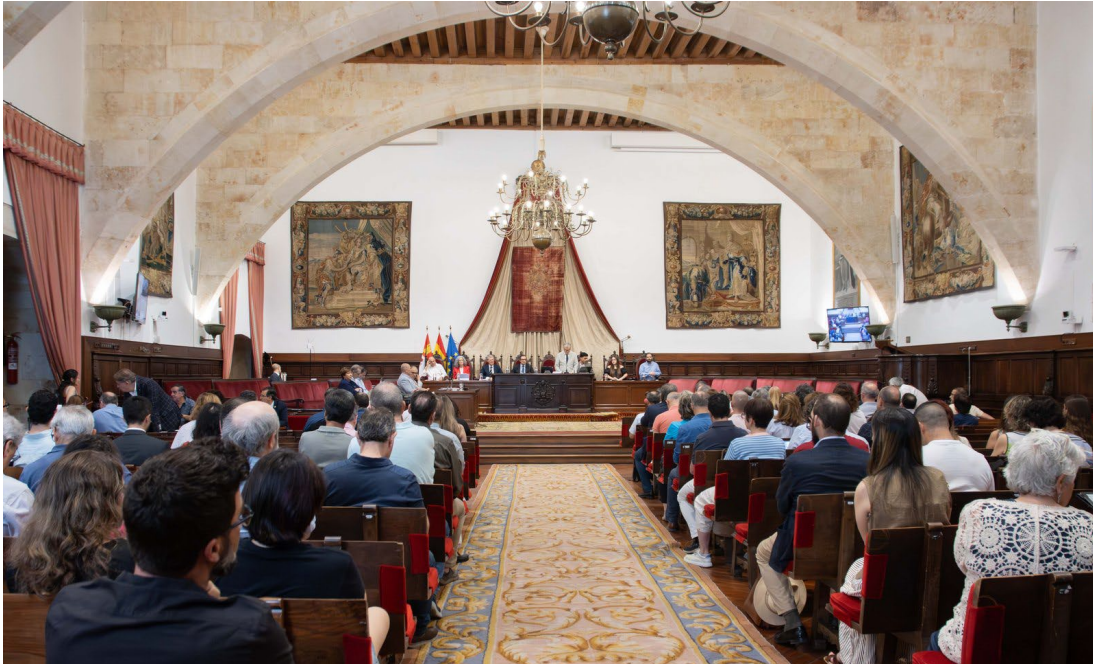
Figura 1. Sesión del Claustro que aprobó los nuevos Estatutos de la USAL con el respaldo del 86% de los votos.