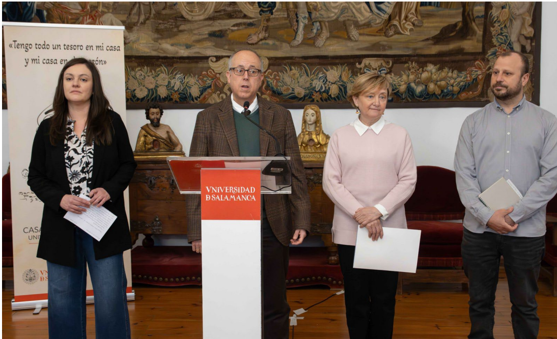
Figura 5. Renaturalización del patio que conecta la Casa-Museo Unamuno con el edificio histórico de Escuelas Mayores.