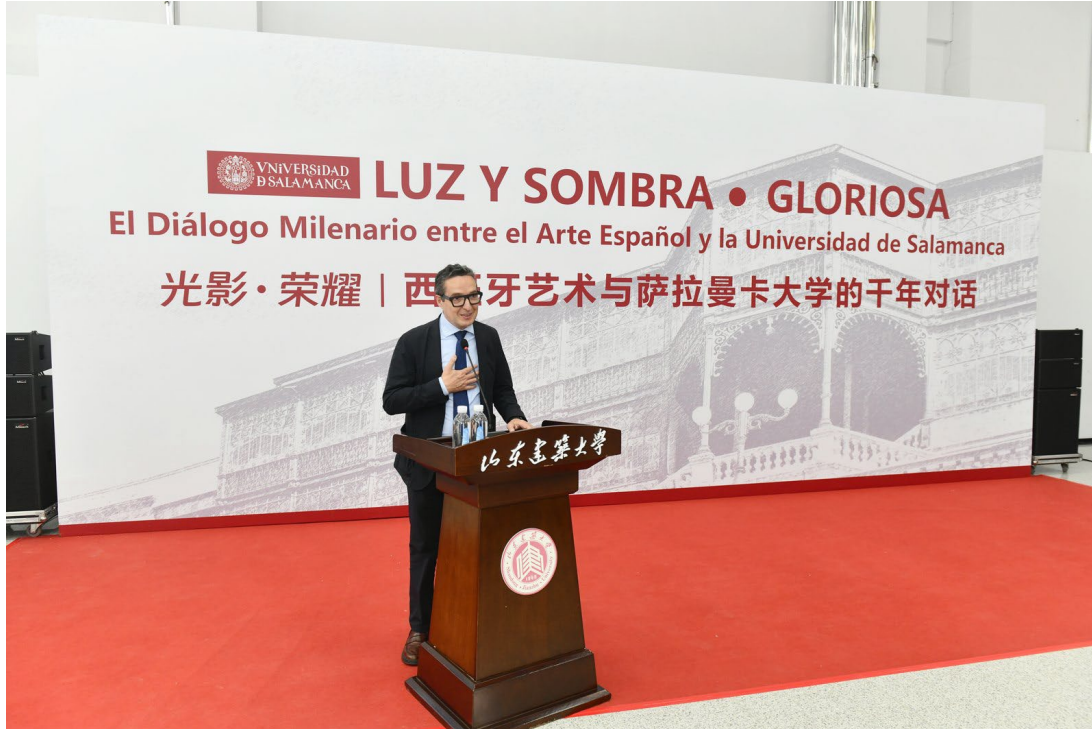
Figura 8. El Rector inaugura el primer campus de la Universidad de Salamanca en China (Shandong).

inaugurado el 9 de junio de 2025. Se encuentran en planificación avanzada los campus de Macao —en colaboración con Huawei y universidades de la Región Administrativa Especial— y de Chongqing, este último con un Centro de Desarrollo Empresarial orientado a la internacionalización de empresas españolas.