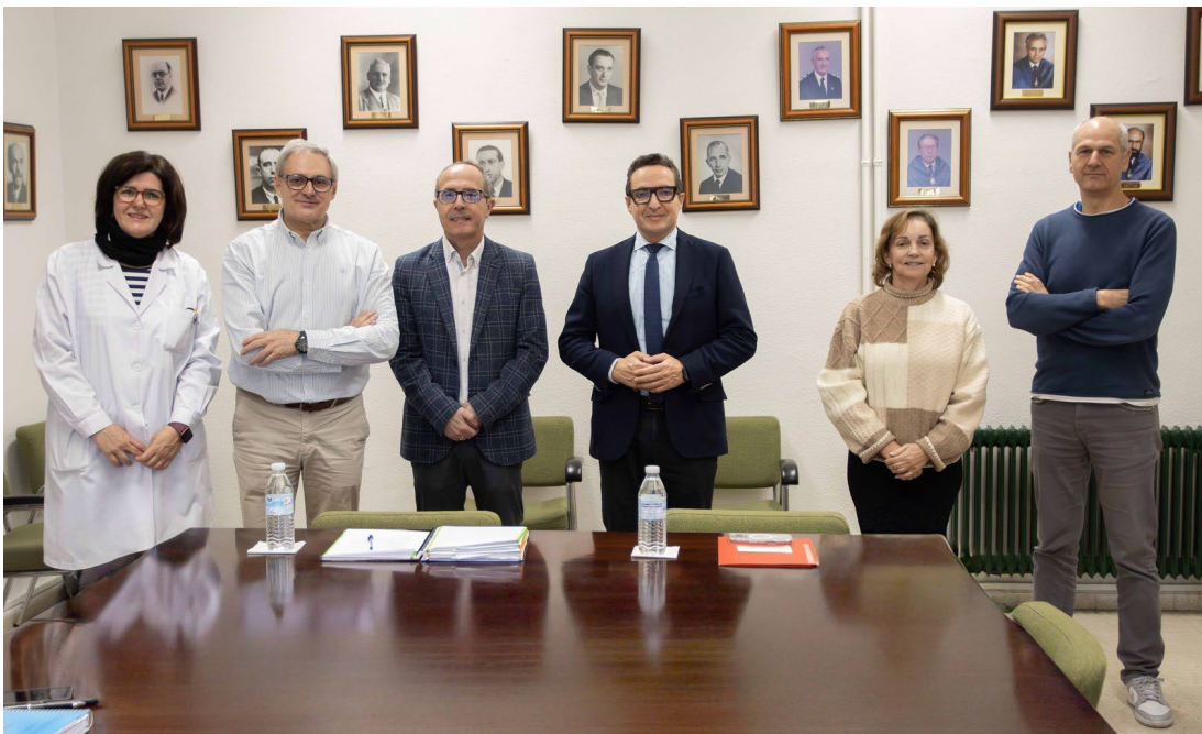
Figura 10. Escuela Politécnica Superior de Ingeniería Industrial de Béjar, que afronta su modernización.

El campus de Béjar afronta su modernización para impulsar su crecimiento y alcanzar el millar de estudiantes. Se ampliarán las aulas docentes con una inversión estimada de 3,45 millones de euros (obra y equipamiento), reforzando la Escuela Politécnica Superior de Ingeniería Industrial.