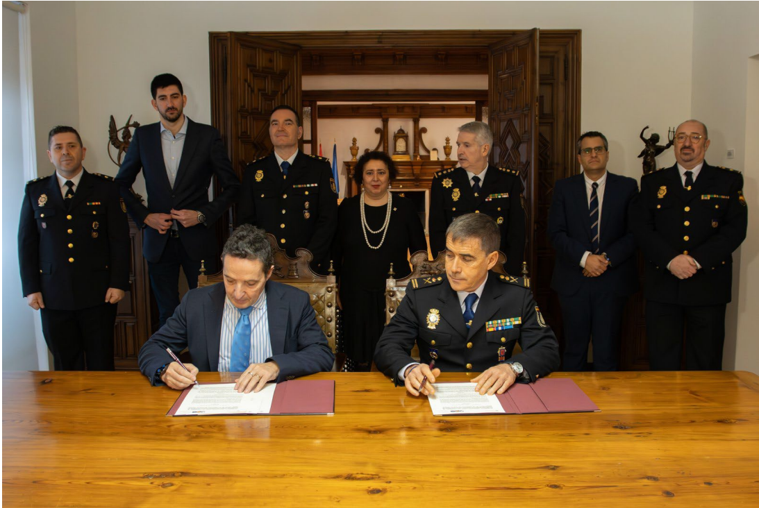
Figura 3. La USAL y la Policía Nacional implantan un laboratorio de ciencias forenses digitales.