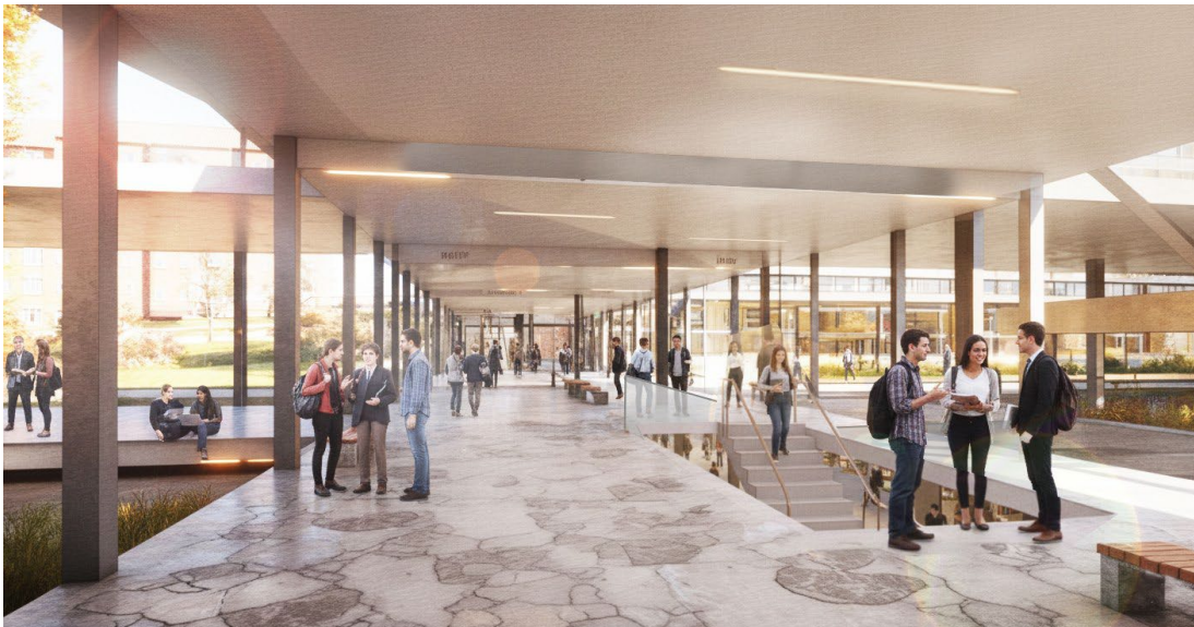
Figura 4. Nueva Facultad/Clínica de Veterinaria. Paseo porticado exterior (infografía).