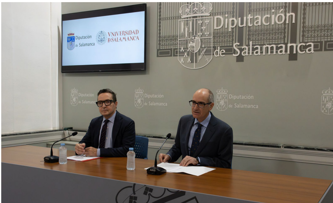
Figura 6. Presentación del proyecto de clínica veterinaria por el Rector y el presidente de la Diputación de Salamanca.