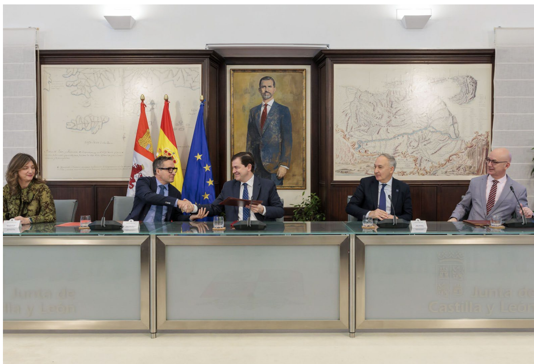
Figura 2. Acto de firma del Protocolo de colaboración con las universidades públicas de Castilla y León.