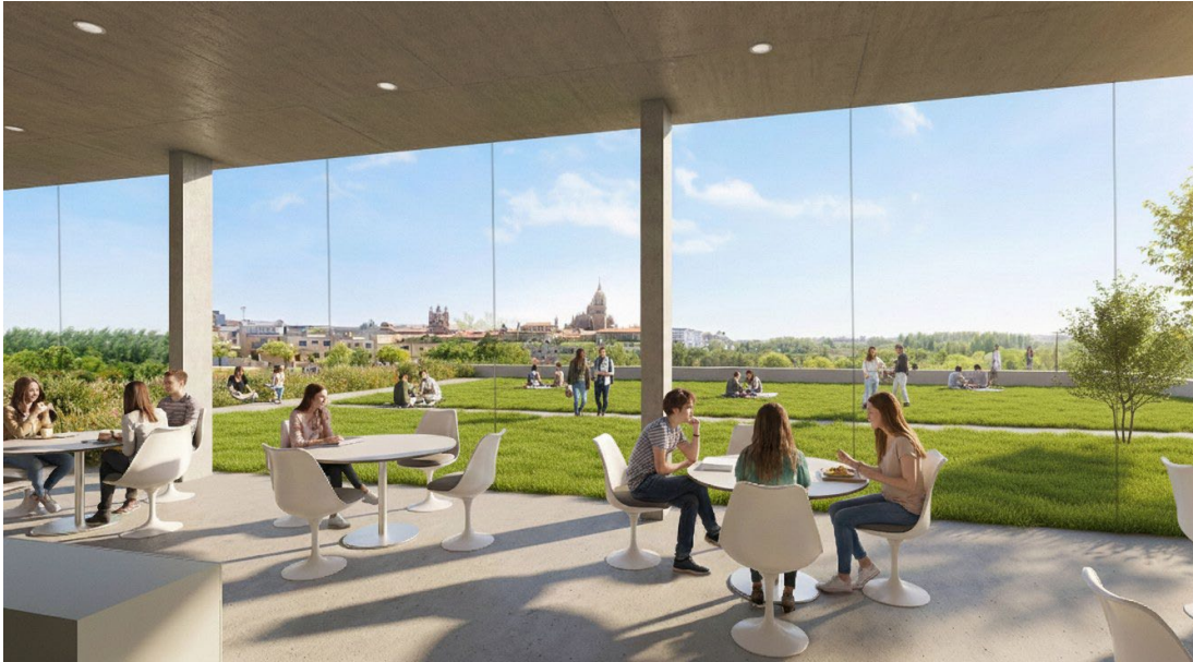
Figura 5. Nueva Facultad/Clínica de Veterinaria. Cafetería en el nivel superior (infografía).