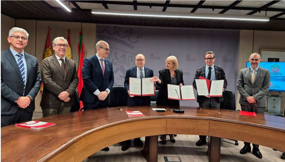
Figura 9. El Campus Viriato albergará FutureLab, un espacio innovador de apoyo a emprendedores y empresas.