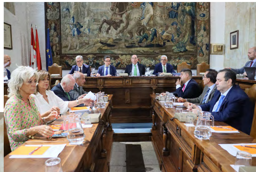
Reunión del Pleno 12/07/2024