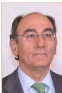
PRESIDENTE CONSEJO SOCIAL D. Ignacio S. Galán