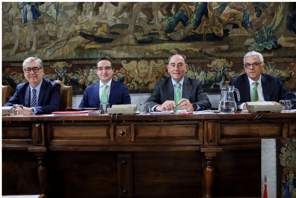
Reunión del Pleno 19/12/2024